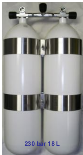
230 bar 18 L