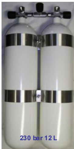
230 bar 12 L