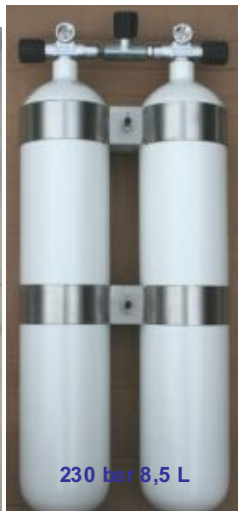
230 bar 8,5 L