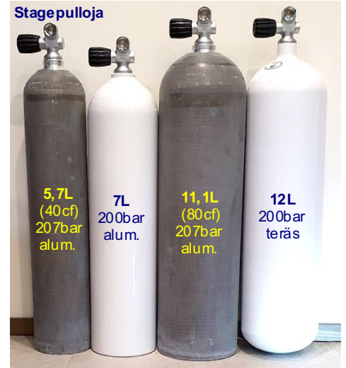
Kuvassa näkyy värit natural ja valkoinen.

Pullon ja venttiilin välinen kierre on M25x2 , poikkeuksena 1L ja 1,8L teräspullot joissa on M18x1,5. Venttiilien ulostulokierre on DIN (G5/8).