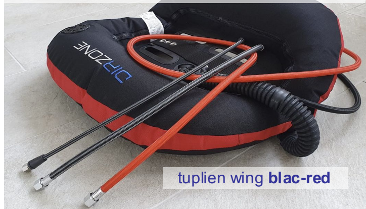
tuuplien wing black-red