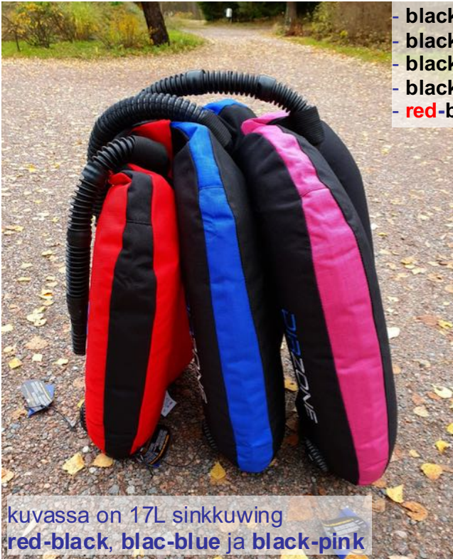
kuvassa on 17L sinkkuwing red-black, black-blue ja black-pink