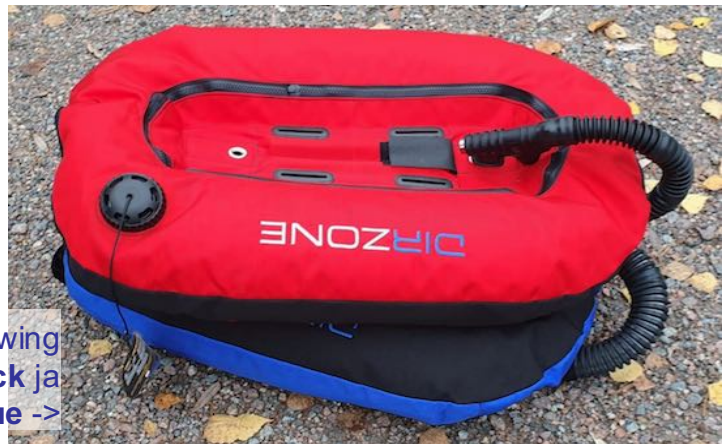
Sinkkuwing red-black ja black-blue ->

DIR ZONE sinkkuwing ei tarvitse erillistä sinkkuadapteria sillä wingissä on adapterina toimiva pullon tuki itsessään. Tuen voi myös poistaa jos halutaan käyttää sinkkuadapteria.