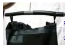
Ripustuslenkit puvun sisällä

Heijastimia kiinnitetään asiakkaan valitsemaan paikkaan. Heijastimia on kahta kokoa (nuolen pituus 95mm ja 140mm)