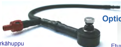
Pissiventtiili pukuun asennettuna