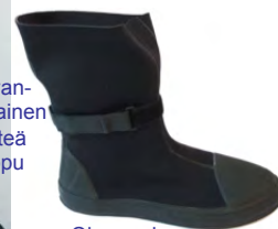
Ohuempi neopreenikenkä Tech Dry Boot