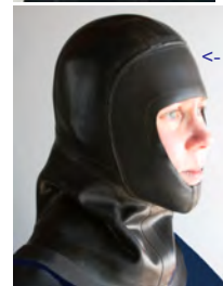
<- Loitokari kuivahuppu