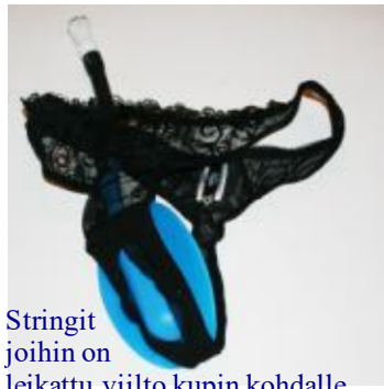
Stringit joihin on leikattu viilto kupin kohdalle pitävät She-P:n hyvin paikallaan.