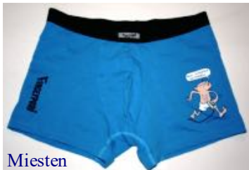
Miesten kalsareissa on tilaa She-P:lle