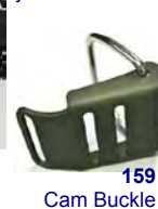
159 Cam Buckle

jossa metallisolki ja maali- pintaa suojaava muovilevy.