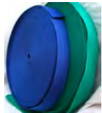
-> Metrihihnoja remelistöön (56306) ja haarahihnaan (56307)