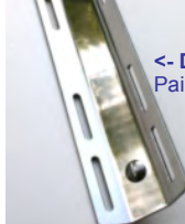
- DZ STA Paino 0.71kg

Letkun voi katkaista sopivaan mittaan. Sopii kaikkiin wingeihin.