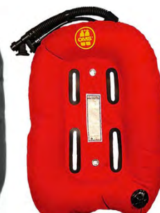
OMS Performance sinkkuwing, 14,5L

DZ tai OMS sinkkuwing ei tarvitse sinkkuadapteria sillä wingissä on adapterina toimiva pullon tuki. DZ wingissä tuen voi myös poistaa jos halutaan käyttää sinkkuadapteria.