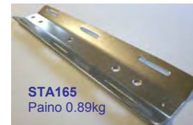
STA165 Paino 0.89kg