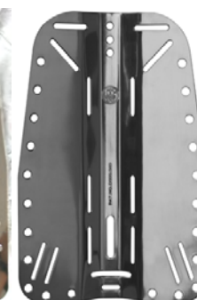
OMSBP 3mm 2,4kg.