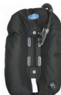
DZ Ring sinkkuwing, koot 14L ja 17L