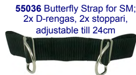
55036 Butterfly Strap for SM; 2x D-rengas, 2x stoppari, adjustable till 24cm