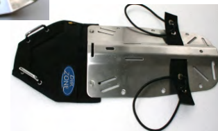
55003 Sidemount Back Pad. Käytetään pullon rigaukseen side mount -tyyliin. Pullo kiipsataan kiinni kahvaan, ja bungeelenkki venttiilin nupin ympärille. Näin pullo on näitisti kinalossa, virtaviivaisesti sukeltajan sivulla.