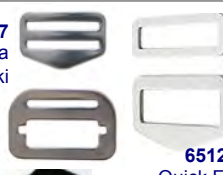
65122 Quick Fix Adjustable solki

126 DZ Haarahihnasetti -> kuten 126, mutta etulenkki on ommeltu (D-lenkki pysyy paikallaan mutta sen sijaintia ei voi muuttaa).