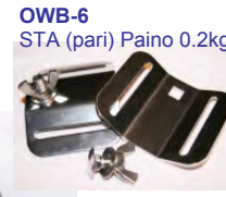
OWB-6 STA (pari) Paino 0.2kg