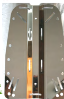
90006 3mm 2,2kg, 90008 6mm 4,6kg

(Teräväreunainen s-levy rikkoo hinnaston, on vaaraksi wingille ja puvulle, ja kuorii s-levyn kyljessä olevasta argonpullosta maalit).