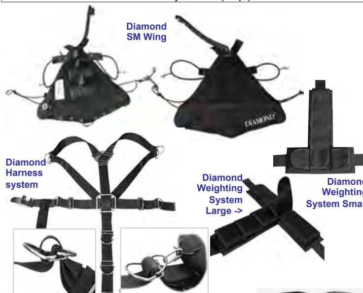
Diamond SM Wing