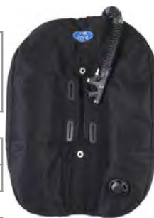
DZ Cub Arctic sinkkuwing 15L

Delrin Thumbwheels M8 / Selkälevytmutterit (2 kpl) HL415 12€ / 174 17€