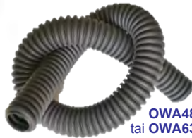
OWA48 tai OWA63

Letkun voi katkaista sopivaan mittaan. Sopii kaikkiin wingeihin.