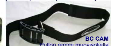
BC CAM Pullon remmi muovisoljella