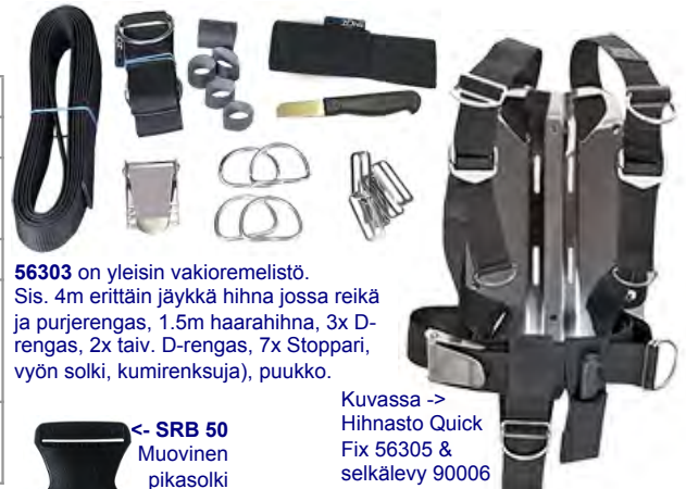
Kuvassa -> Hihnasto Quick Fix 56305 & selkälevy 90006

56303 on yleisin vakioremelistö. Sis. 4m erittäin jäykkä hihna jossa reikä ja purjerengas, 1.5m haarahihna, 3x D-rengas, 2x taiv. D-rengas, 7x Stoppari, vyön solki, kumirenksuja), puukko.