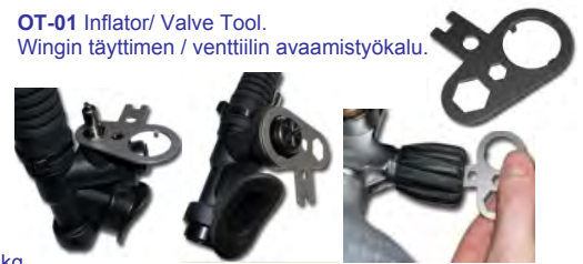
OT-01 Inflator/ Valve Tool. Wingin täyttimen / venttiilin avaamistyökalu.