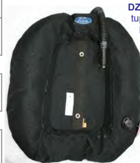
DZ Stream -> tuplien wing, koot 20L ja 25L

DZ tai OMS sinkkuwing ei tarvitse sinkkuadapteria sillä wingissä on adapterina toimiva pullon tuki. DZ wingissä tuen voi myös poistaa jos halutaan käyttää sinkkuadapteria.