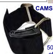
CAMS Remeli pienen pullon kiinnittämiseen 50mm hihnaan. (esim. 3L off board repepullo, pieni poni- tai argonpullo, akkupönttö tms.)