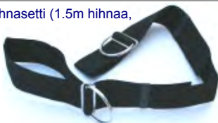
65107 Avattava solki

126 Haarahihnasetti (1.5m hihnaa, 2 stopparia, 2 D-lenkkiä, 2 kumirenksua)