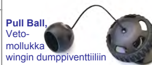
Pull Ball , Veto- mollukka wingin dumphiventtiiliin