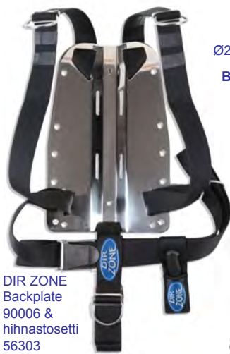
DIR ZONE Backplate 90006 & hinnastosetti 56303