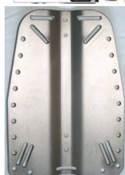
Alumiiniselkälevyt 3mm 0,8kg ->

<- HBP 6mm, 5kg. Laadukas painava selkälevy. Terävät särmät on koneistettu pyöreiksi. Sivussa riittävästi reikiä esim. argonpullon kiinnitykselle. Korkeussuunnassa säädettävä (kahdet kiinnitysreiät).