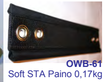
OWB-61 Soft STA Paino 0,17kg