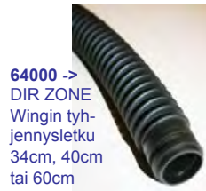
64000 -> DIR ZONE Wingin tyhjennusletku 34cm, 40cm tai 60cm