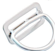
D45 D+stop 45°

HL925 Deluxe Drop D, D-lenkin voi asentaa pystyyn tai vaakaan (ruuvi kiinnitys).