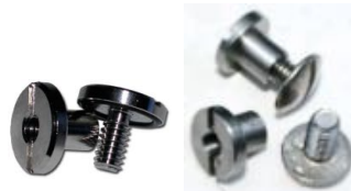
Sex Bolt & 144, varusteiden kiinnittämiseen selkärengas