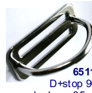
65114 D+stop 90° korkeus 35mm