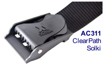
AC311 ClearPath Solki