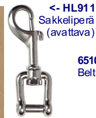
65105 -> Belt Buckle

Isot hakaset sopivat stagerigaukseen, pienet esim. varalampun, painemittarin tai pitkän letkun kiinnitykseen