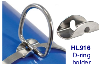
HL916 D-ring holder letkunkiristimeen