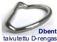
Dbent taivutettu D-rengas