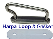
Harpa Loop & Gasket