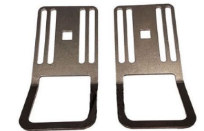
HA-052 2 kpl SM D-lenkkejä