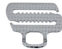
HW1089 Chop Lock D-lenkki asennetaan purkamatta hihnasta