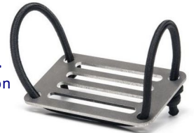
HA-026 -> Akkuöntön pidin

Argon straps Kiinnitys ruuveilla selkärengas. Sis. 2 pullopantaa ja kiinnitysruuvit